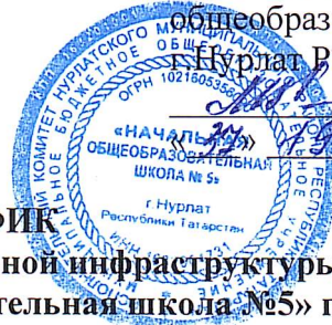
ГРАФИК использования спортивной инфраструктуры МБОУ «Начальная общеобразовательная школа №5» г.Нурлат РТ населением во внеучебное время на _____ 2026 года (месяц)